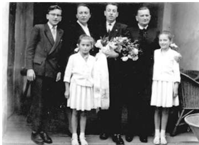
Szüleimmel és testvéreimmel (1959.)

Hatvannégy év óta élek együtt a konfirmáció ajándékaival, és egyre inkább meggyőződésem, hogy nekem mind közül az áldás volt a legnagyobb jelentőségű.