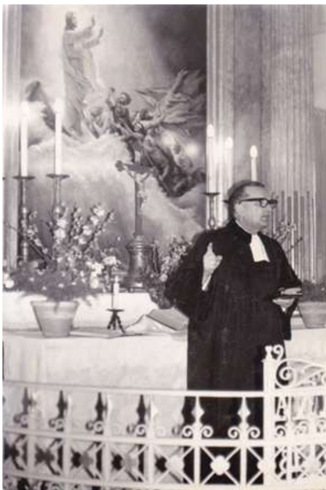
Édesapám az ágfalvi oltárnál (1970.)

Ágfalván konfirmáltam 1960. április 24-én. Édesapám 28 évig volt a falu lelkésze. Természetesen valamennyi gyereket ő konfirmálta, én a harmadik voltam a sorban.