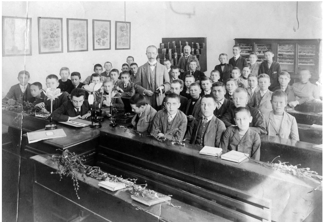
Líceum, 1918.

A gyülekezetben nem csak egyházi évben és naptári évben, hanem munkaévben is számolunk. A munkaév az iskolaévhez igazodik, tehát szeptember a gyülekezeti hétközi alkalmak újraindulásának az ideje is. Átvitt értelme is van ennek az egybeesésnek: arra is utal a gyülekezeti munkaév szeptemberi kezdete, hogy Isten nevelni, tanítani