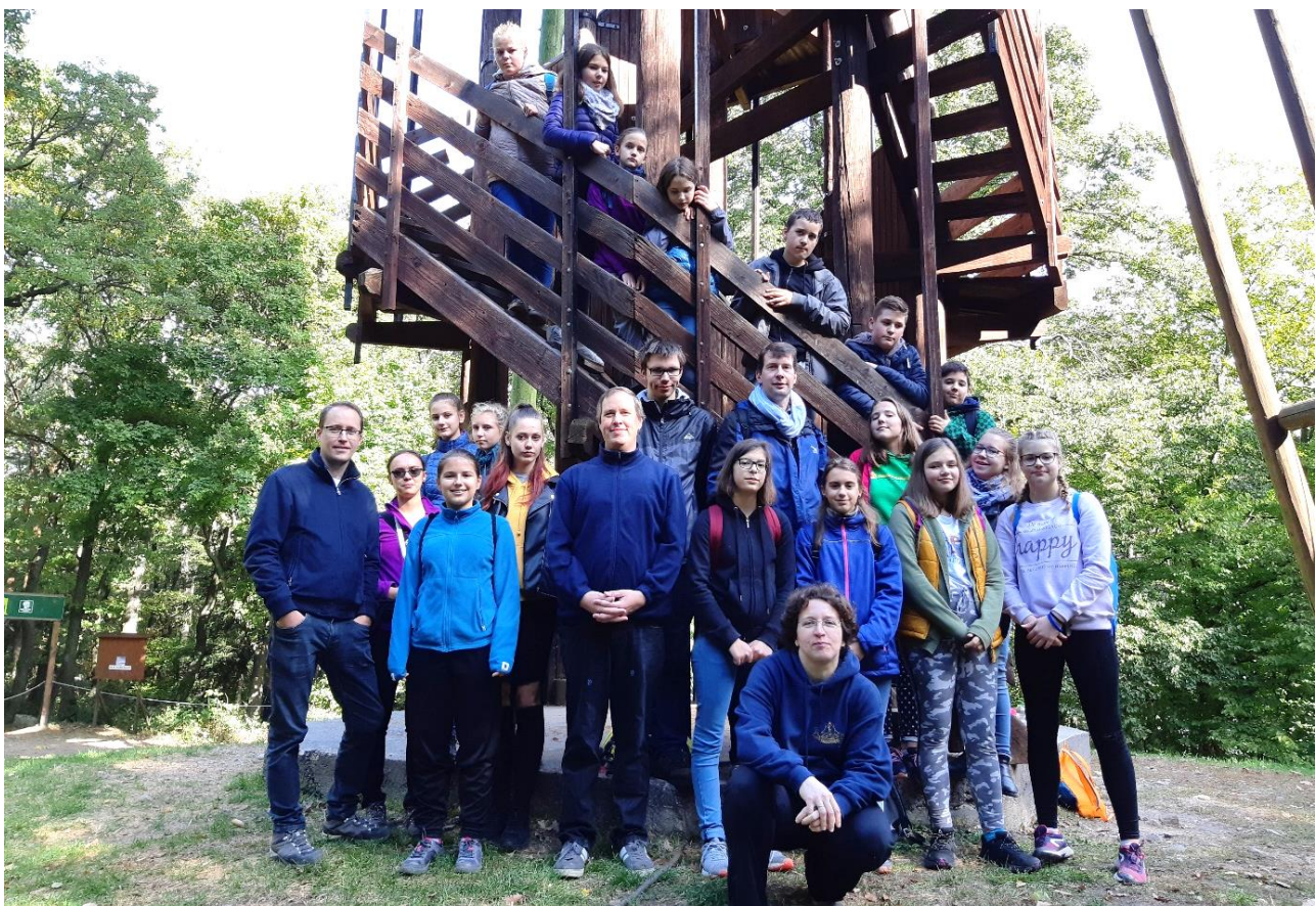
Október közepén gyülekezetünk ifjúságának és idejének egy csoportja együtt kirándult a soproni hegyekben.

Felhasznált irodalom: Payr S.: A soproni ev. egyházközség története., Domonkos Ottó: A soproni evangélikusok perselyládájának olajfestménye a 17.sz. második feléből, Sikabonyi Gálffy Ernő: A Gálffy család története Bp. 1966. Kézirat (Soproni ev. levéltár), Hanzmann K.: Helyzetrajz és adalékok a soproni ev. egyházközség 1900-1950. történetéhez, Tschürz N.: A soproni temetők története 1998. Sírméleki 2006., A soproni ev. gyülekezet évszázadai. Katalógus 2017.