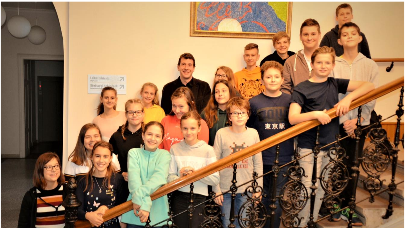
Die deutsche Konfirmandengruppe

Manchmal läuft man Gefahr, sich zu wiederholen. Zum Beispiel bei der Verkündigung von Rekorden. 2015 kündigten wir einen „Rekordjahrgang“ seit 1946 an mit – damals unvorstellbaren – neun deutschen Konfirmanden. 2017 folgte die Einstellung des Rekordes mit zwölf Konfirmanden. Und nun dürfen wir sage und schreibe neunzehn Jugendliche in der deutschen Konfirmandengruppe begrüßen. Aber es geht ja nicht um die Zahl. Wichtig ist doch, dass die Gemeinde sie sowohl im Miteinander als auch im Gebet auf dem Weg zur Konfirmation begleitet. Und damit das geht, ist es gut, wenn man sich auch kennt. Die neuen deutschen Konfirmanden schreiben davon, warum sie konfirmiert werden möchten und worauf sie sich freuen.