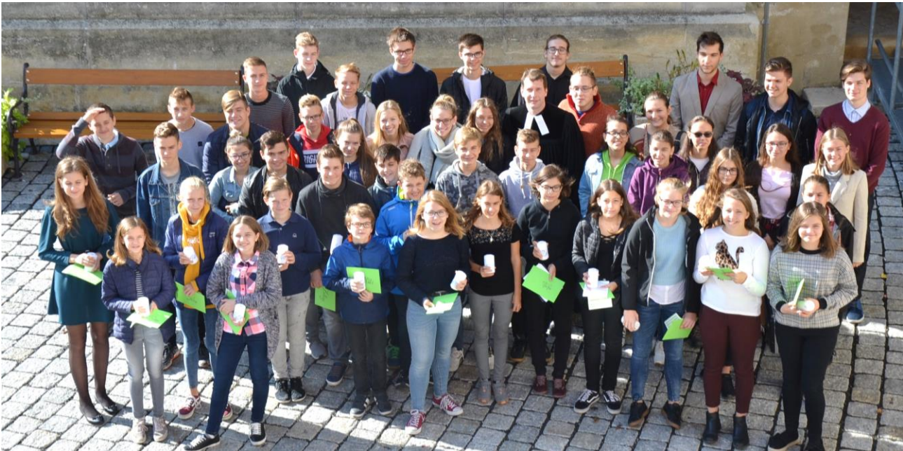
Die Konfirmanden mit früheren Konfirmierten und Mitgliedern der Jugendgruppe nach dem Konfirmandenvorstellungsgottesdienst, bei dem wir über 160 Gottesdienstbesucher begrüßen konnten.

Weg ja nicht erst jetzt, nicht erst heute in diesem Gottesdienst. Denn am Anfang stand eure Taufe. Für viele von euch und für viele Gemeindeglieder war das an diesem Taufstein hier in unserer Kirche. Zur Erinnerung daran, dass wir getauft sind, entzünde ich eine Kerze und stelle sie auf den Taufstein.