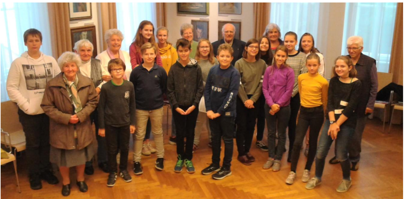
Die deutschen Konfirmanden mit einigen Besuchern der Wochenpredigt