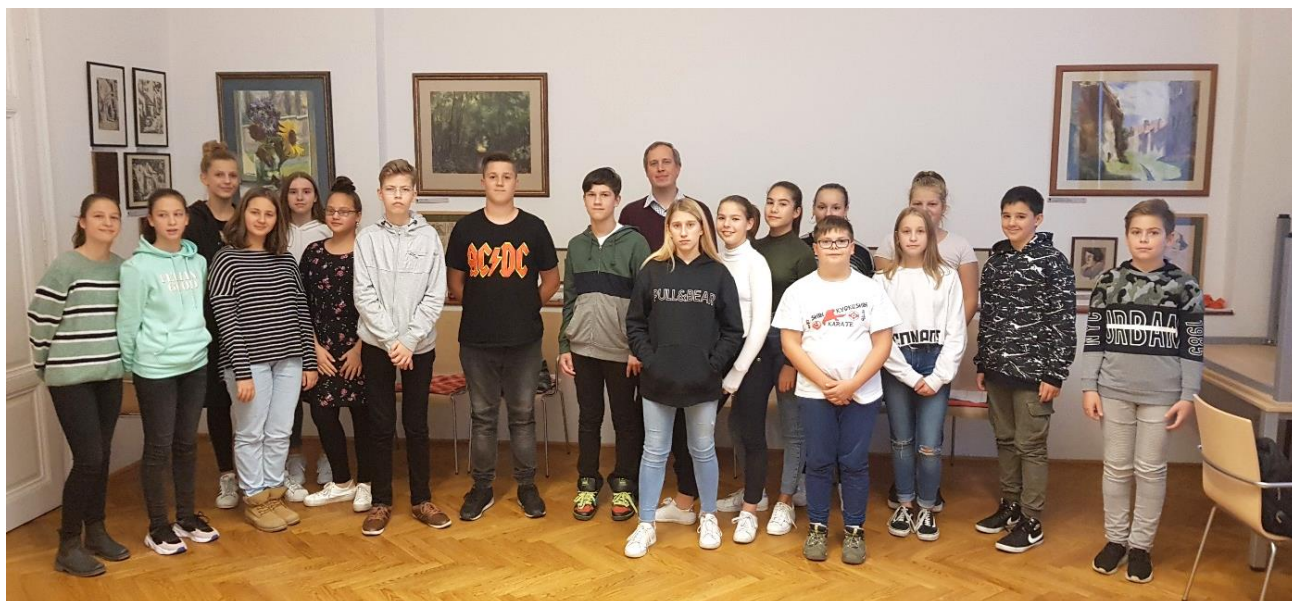
Az idén 26-an jelentkeztek a magyar nyelvű konfirmációi oktatásra. Isten áldása legyen a felkészülésükön, közösségükön!