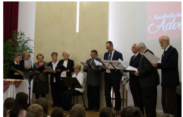
„Ich steh an deiner Krippen hier“ sang unser Gemeindechor.