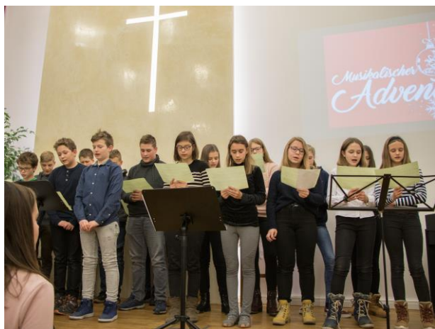
„Es ist ein Ros entsprungen“ singen die deutschen Konfirmanden