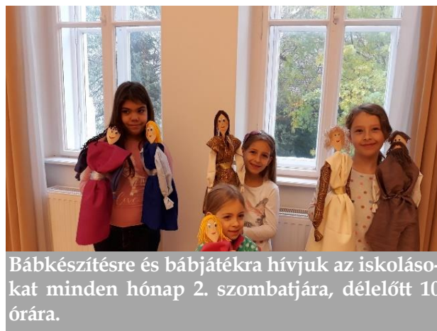
Bábkészítésre és bábjátékra hívjuk az iskolásokat minden hónap 2. szombatjára, délelőtt 10 órára.

Glaubensgesprächskreis – német beszélgetőkör január 10-én, 24-én, február 14-én, 28-án, pénteken 15.30-kor a lelkészi hivatalban Kirchenkaffee január 19-én és február 16-án, vasárnap 10 órakor a kisteremben gyerek-istentiszteleti teaház január 12-én és február 9-én, vasárnap 10 órakor a kisteremben baba-mama kör január 15-én, február 5-én és 19-én, szerdán 10 órakor az ifiteremben Kindergruppe – német gyerekcsoport január 8-án, 22-én, február 12-én, 26-án, szerdán 16.30-kor a kisteremben barkácskör minden pénteken 15 órakor a társalgóban