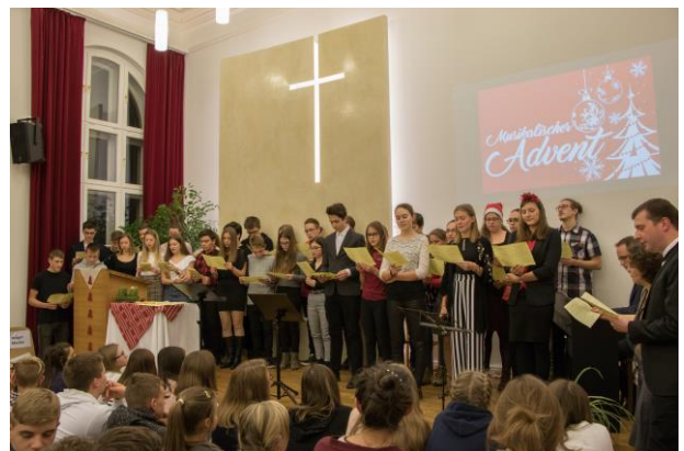
Die Jugendgruppe sorgt für das Finale des Abends.