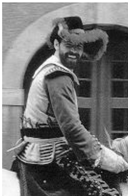
Pünkösdi király - Németország

A pünkösdi királyt a legények közül választják ügyességi versenyeken. Európa nagy részén a középkor óta élő szokás, gyakoriak a lovas versenyek, különféle ügyességi próbák, küzdelmek. Magyarországon a XVI. századtól kezdve vannak írásos nyomai a hagyománynak. Legérdekesebb leírása Jókai Egy magyar nábob című regényében olvasható. A pünkösdi király megválasztása után egy évig "uralkodott", azaz ő parancsolt a többi legénynek, az ivóban ingyen ihatott, minden lakodalomra, mulatságra meghívták.