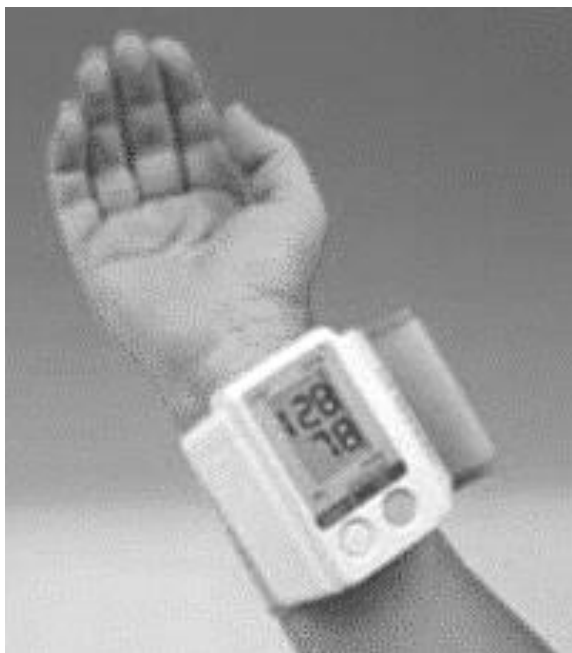
Magasvérnyomás. A leggyakoribb érelmeszesedést okozó rizikótényező.

Tudta, hogy a 60 évesek között már jó eséllyel több a magasvérnyomás-beteg, mint akinek gyógyszer nélkül is „jó” a vérnyomása? Tudta, hogy a magasvérnyomás-betegség is lassan, kis emelkedéssel indul, és évekig – sok esetben évtizedekig – nem okoz panaszt? Tudta, hogy ha szülei között van magasvérnyomás-beteg, Ön is veszélyeztetett? Tudta, hogy aki otthonában, nyugalomban mérve, ismételten 130/80-85-öt elérő vérnyomást mér, nagy valószínűséggel magasvérnyomás-beteg? Tudta, hogy gyógyszeres kezeléssel el lehet és el is kell érni, hogy vérnyomásértékei ne különbözzenek az egészségesek vérnyomásértékeitől (otthon legalább 130/80-85 alá kell szorítanunk)? Tudta? És... Önnél 130/80-85 alatt van?