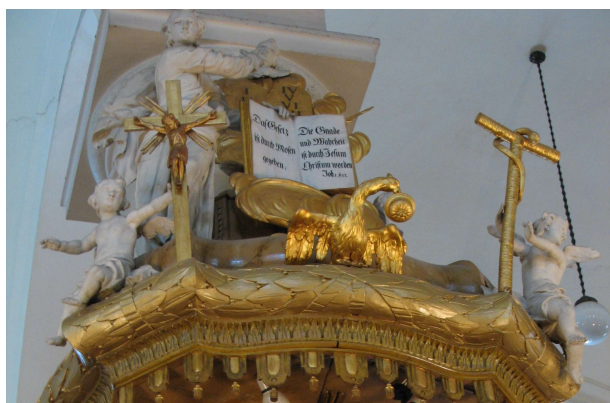
„A törvény Mózes által adatott, a kegyelem és az igazság Jézus Krisztus által jött el.” (Jn 1,17)

Ha már elfogadtad Krisztust mint üdvösséged alapját és velejét, akkor következik a második pont, hogy példát végy róla, s úgy szenteld magad felebarátod szolgálatára, ahogyan – mint látod – ő neked szentelte magát. Lásd, ettől kap