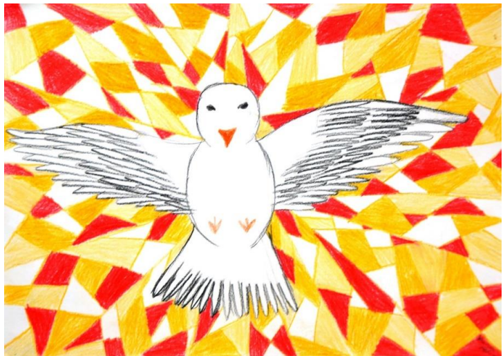
A rajz Varga Petra alkotása

Magunkra ismerhetünk benne. Mi is szívesen lennénk hitben erősek, hittestvéreink előtt is járva példával, becsülettel, de mindez sokszor csak szép szavakban mutatkozik meg, nem pedig szívben megélt Isten-kapcsolatban. Az anyagi biztonságunk, a kényelmünk, vagy az álmaink iránti elkötelezettségünk éppúgy erősebbnek tud bizonyulni, mint Péter számára. Sokszor kell megállnunk szerényen önvizsgálattal: inkább szerettük volna a