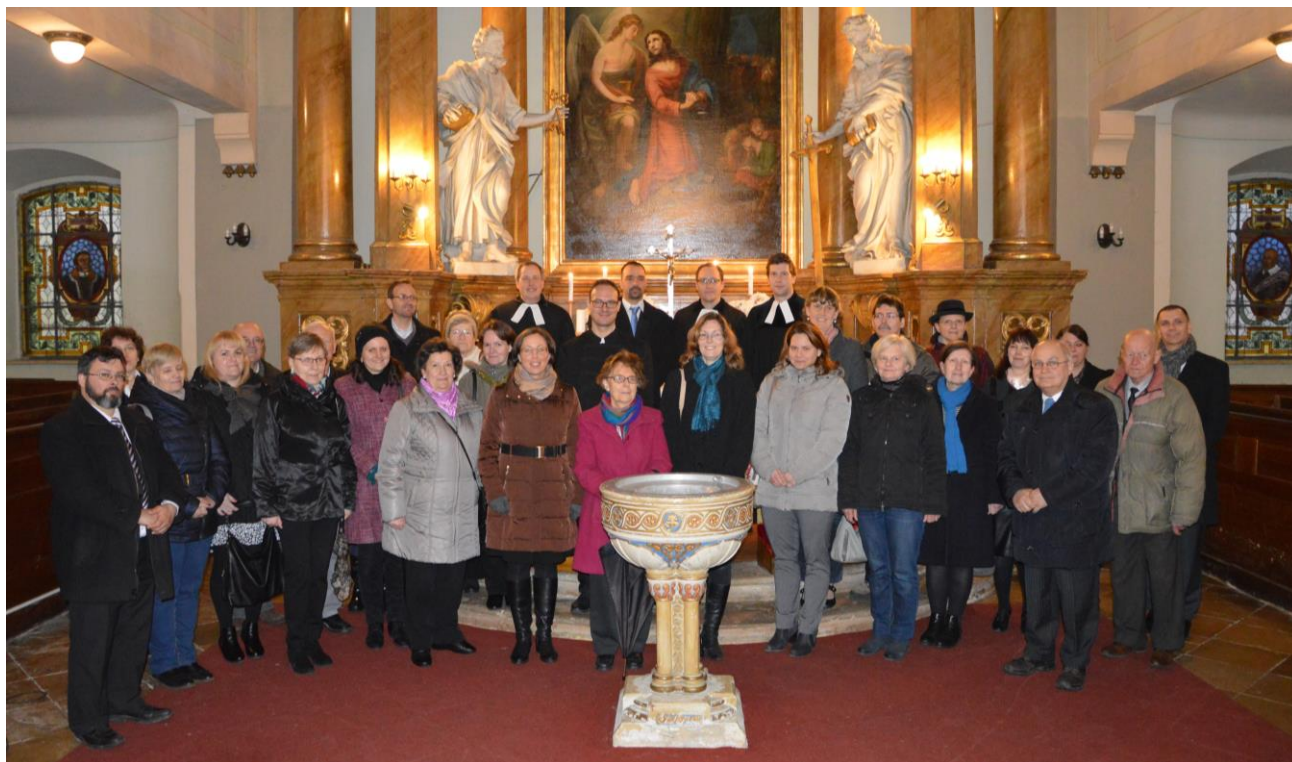
A gyülekezet tisztségviselői és testületi tagjai a nagycsütörtöki beiktatáskor