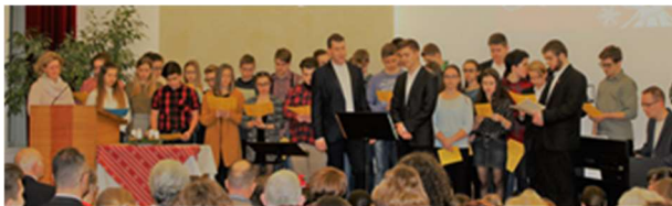
Wieder ist ein Jahr vergangen – die Jugendgruppe