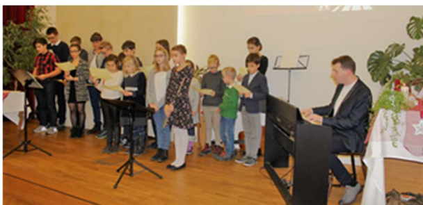
O Tannenbaum – die Kindergruppe