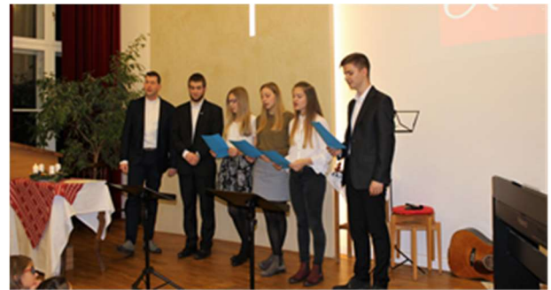
„Musikalischer Advent ist vorbei“

Fotos: Dániel Mátis Zusammenstellung: Holger Manke