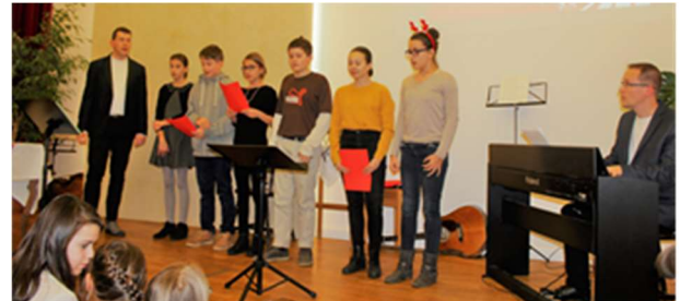
Alle Jahre wieder singen die deutschen Konfirmanden.