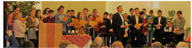
Weihnachtsmelodien mit der Jugendgruppe