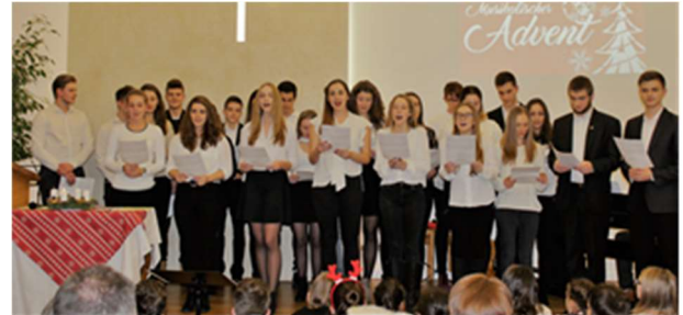
Kommt und lasst uns Christum ehren – die Klasse 12c des Lyzeums