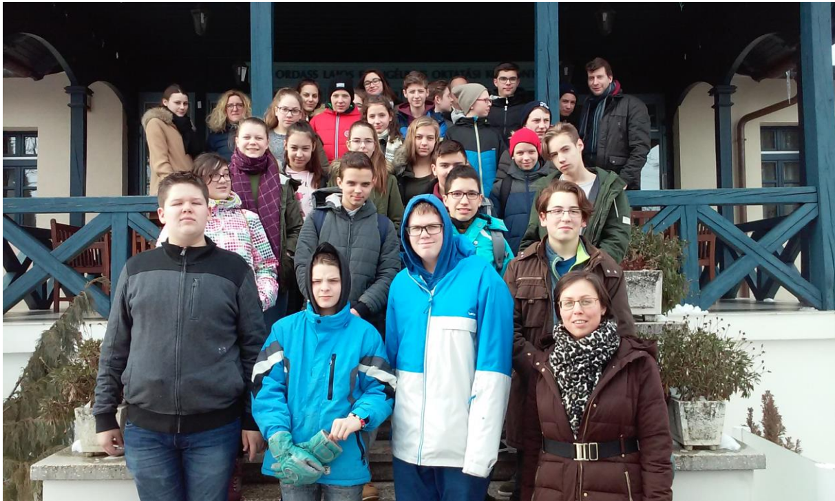
Március elején a német és a magyar konfirmandusok közös hétvégét töltötték Révfülöpon.