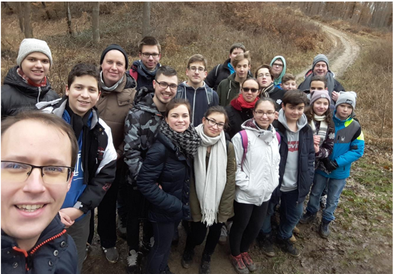
Február 3-án közös erdei túrát tettek a német és a magyar nyelvű konfirmanduscsoport, valamint az ifi tagjai.