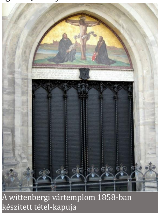
A wittenbergi vártemplom 1858-ban készített tétel-kapuja